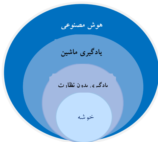
شکل ۱. جایگاه خوشه‌بندی، اقتباس از ویتن و همکاران ۲۰۱۷ (۱۲)

«خوشه‌بندی» ۱ یکی از تکنیک‌های علم یادگیری ماشین است که شامل گروه‌بندی نقاط داده می‌شود. با توجه به مجموعه‌ای از نقاط داده، می‌توان از یک الگوریتم خوشه‌بندی برای طبقه‌بندی هر نقطه داده به یک گروه خاص استفاده کرد. در تئوری، نقاط داده‌هایی که در یک گروه قرار دارند باید دارای خصوصیات و یا ویژگی‌های مشابه باشند، درحالی‌که نقاط داده در گروه‌های مختلف باید دارای خصوصیات و یا ویژگی‌های بی‌شبهت باشند. خوشه‌بندی حاصل در این پژوهش (شکل یک) محصول روش یادگیری ماشین، بدون نظارت است و یک روش معمول برای تجزیه و تحلیل داده‌های آماری است که در بسیاری از زمینه‌ها مورد استفاده قرار می‌گیرد. محققین با مشاهده و استخراج روابطی که از داده‌ها شکل گرفته می‌توانند اطلاعات ارزشمندی به دست آورند.